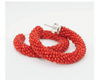
Creolen Hoop earrings