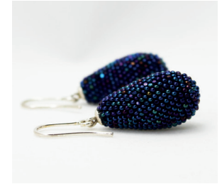
Ohrhänger Tropfen Eardrops drop-shaped