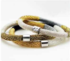
Armband schmal Bracelet thin