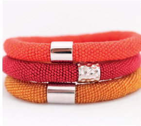
Armband klassisch Bracelet classic