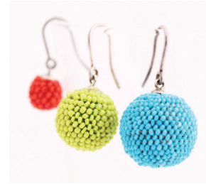
Ohrhänger S, M, L Eardrops small, medium, large