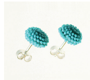
Ohrstecker Ear studs