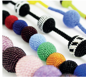
Kugelhalskette Ball necklace