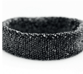
Armband breit Bracelet wide