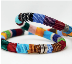
Halskette Rope necklace