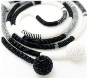
Kette lang Extra long necklace