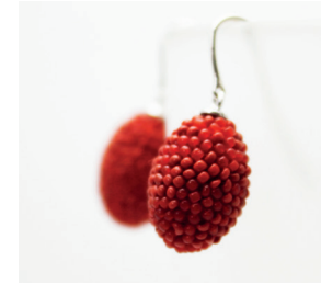
Ohrhänger Olive Eardrops olive