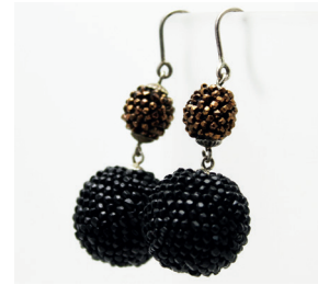
Ohrhänger kombiniert Eardrops combined

Die Silberelemente sind Sterlingsilber. Den Schmuck fertige ich in vielen Farben, Größen und auch nach individuellen Wünschen an.